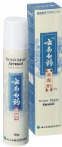
Yunnan Baiyao Aerosol