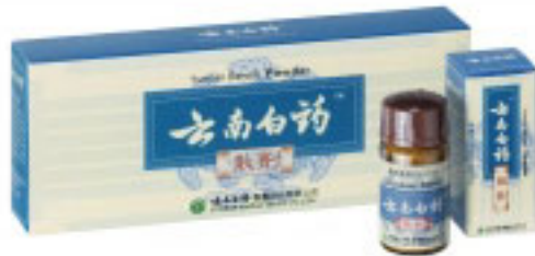
Yunnan Baiyao Powder